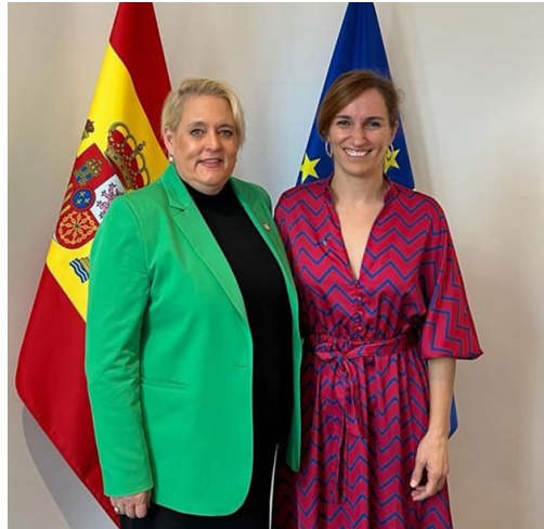
Figura 2 Presentación del documento técnico Estigma y discriminación asociados al VIH: el reto , en el Acto conmemorativo del Parlamento Europeo. Bruselas, 1 de diciembre de 2023. En la imagen, Christine Stegling, Directora ejecutiva adjunta de ONUSIDA (izquierda) y Mónica García, Ministra de Sanidad (derecha).

Este documento fue presentado por la delegación española, liderada por la Ministra de Sanidad, Mónica García, el 1 de diciembre de 2023, Día Mundial del Sida, en el Parlamento Europeo (Bruselas).