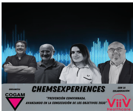
Invitados en los podcast.