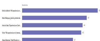
Tabla 1. Reproducciones por episodios.