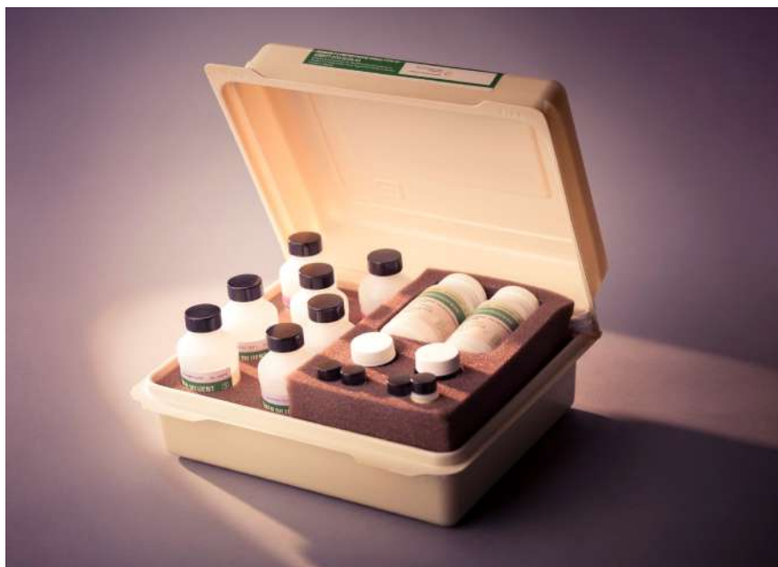
Figura 1: Primer kit de la prueba del VIH, aprobado por la FDA